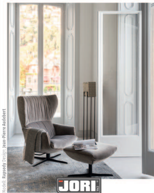
Modell: Rapsody Design: Jean-Pierre Audebert